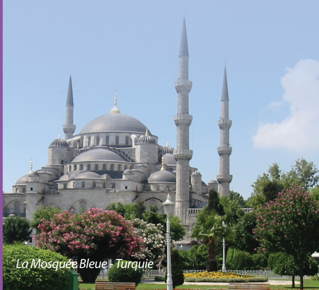
La Mosquée Bleue - Turquie