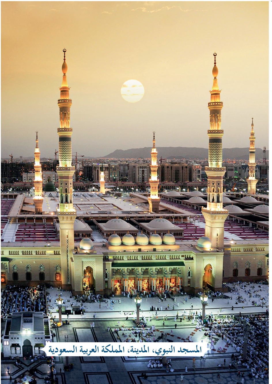
المسجد النبوي، المدينة، المملكة العربية السعودية