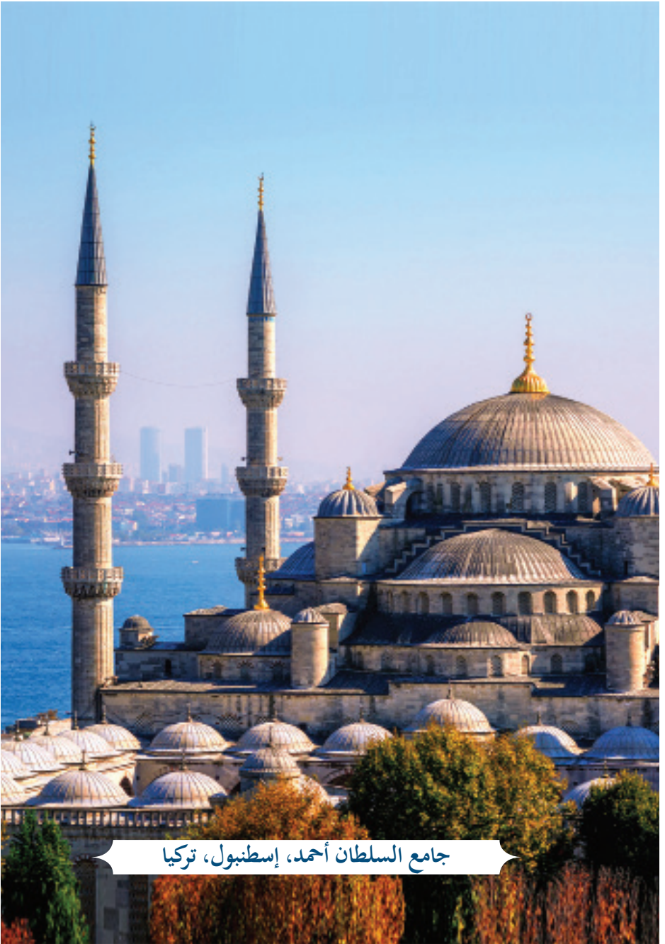
جامع السلطان أحمد، إسطنبول، تركيا